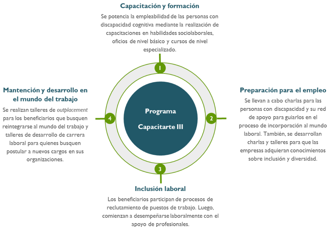
Diagrama de los principales componentes del programa Capacitarte III: