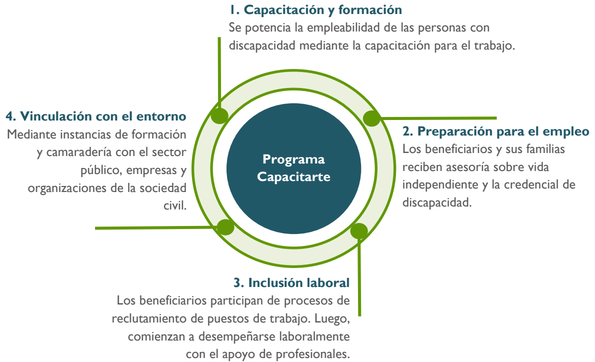
Diagrama del programa Capacitarte: